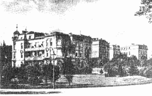
The Wiener Cottage Sanatorium

Resim 2: Atatürk'ün Viyana'da tedavi gördüğü Cottage Sanatoryumu