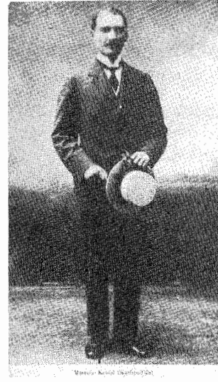
Resim 1: Atatürk Viyana'da, yeni aldığı kıyafetleriyle (1918)